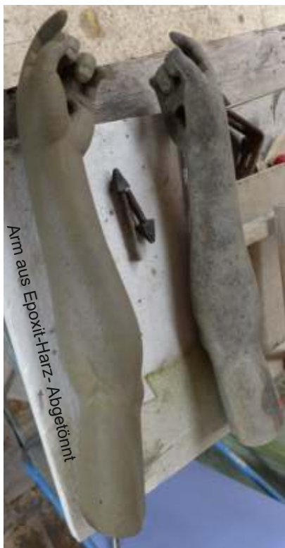
Nach der Reinigung