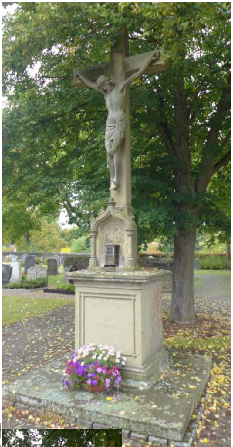
Aufnahmen am alten Standort von 16.09.2021

Wie vor drei Jahren in Oberbach wo ein Stück des Querbalkens ein 20 x 20 cm großen Stück aus der Sockelplatte schlug.